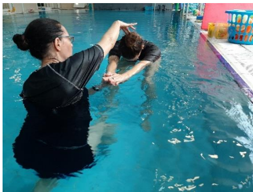
תמונה 6: תמונת אילוסטרציה של הנחיה פיזית