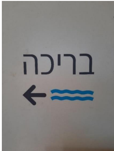
תמונה 4: דוגמה לשילוט מונגש

על מנת לאפשר נגישות למידע המופיע בשלטים במרחב הבריכה, חשוב להקפיד על מיקום השילוט במקום פנוי מציוד שעלול להסתיר אותו. כמו כן, עיצוב השלט חייב להיות מותאם לאוכלוסיית לקויי הראייה. ניתן לעשות זאת על ידי הקפדה על רקע שלט אחיד וחלק וכיתוב בצבע מנוגד לצבע הרקע. הכיתוב יהיה מודגש, גדול ובולט (תמונה 4). יש להעדיף שלט בגוון לא מבריק ולשים לב שאין החזרה של אור מהשילוט. עבור אנשים עם עיוורון יש להשתמש בכתב ברייל.