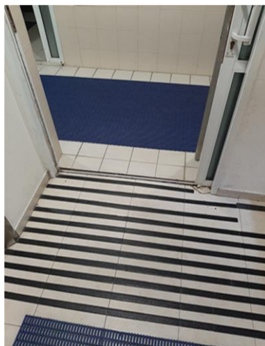
תמונה 1: הבדלים במרקמים ובצבעים של האזורים השונים בבריכה