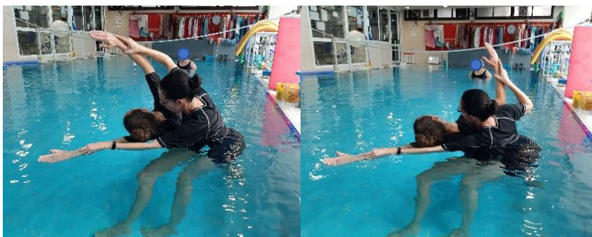
תמונה 7: תמונת אילוסטרציה של תנועה משותפת

חשוב לזכור שהמעברים עבור אנשים עם לקויות ראייה או עיוורון מהווים אתגר (לדוגמה: מעבר משפת הבריכה למים או עלייה למזרון צף). כל מעבר כרוך בשינויי מנח הגוף ובשינויי עומק הטבילה. מכיוון שהיכולת לראות את השינויים העומדים להתרחש מוגבלת או אינה קיימת, מעברים אלו מהווים גירוי חושי שיש לתת לו זמן עיבוד. בניגוד לאנשים רואים, אנשים עם לקויות ראייה או עם עיוורון תלויים בהנחיית המורה/המטפל ולא יצליחו להתכונן למעבר או לשינוי במנח הגוף אם המורה/המטפל לא יאמר זאת מפורשות. חשיפה למעברים ולשינויים צריכה להיות ממושכת יותר, עם חזרות רבות אך קצרות.