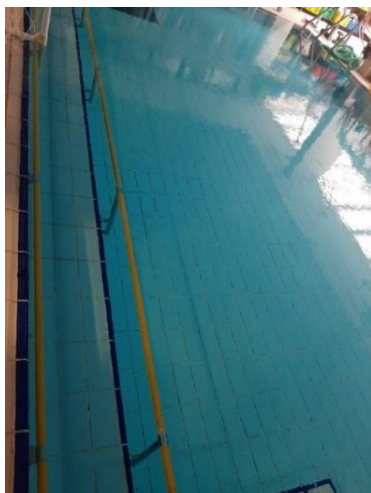
תמונה 3: מעקה בצבע צהוב שהוא צבע ניגודי לצבע הכחול (נועד במקרה זה לקביעת גבול הליכה)